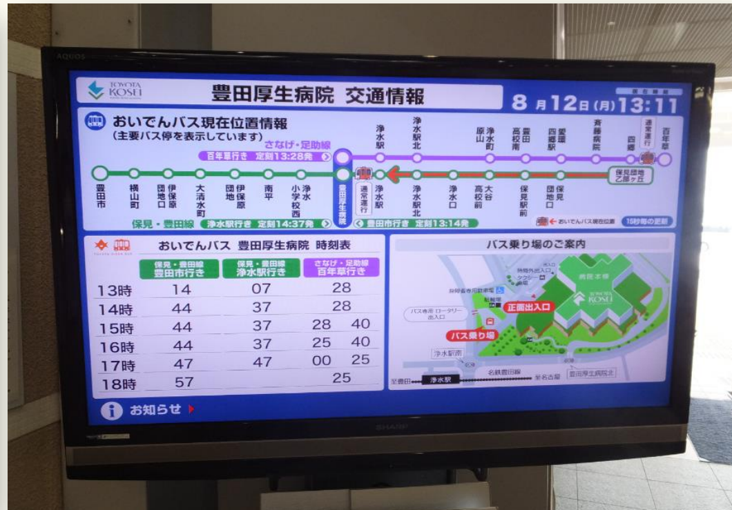
豊田厚生病院 バス案内ディスプレイ