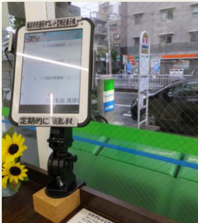
コンビニでバス接近表示