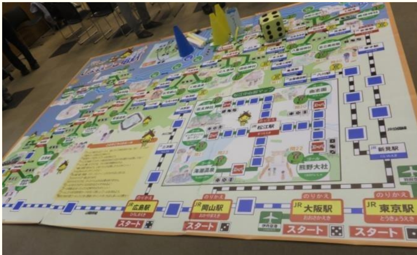
どこでもバスマップすごろく松江