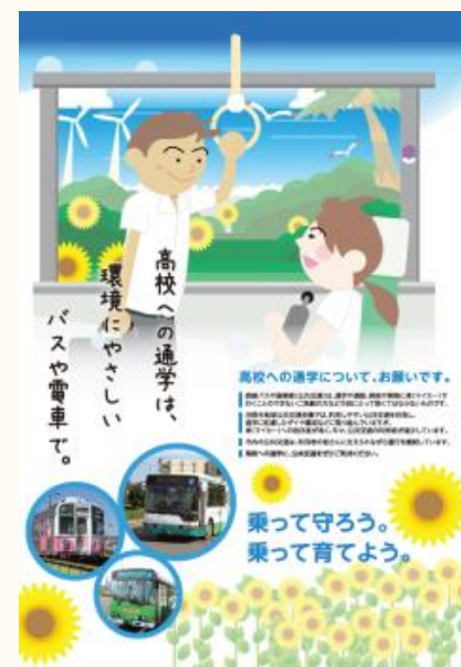
田原市の学生向けパンフレット